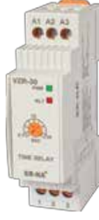
VZR-30 V-OTOMAT DIN