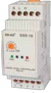
SSR-10 KLASİK DIN