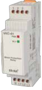
VKC-01 V-OTOMAT DIN