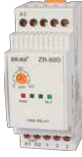
ZR-60D KLASİK DIN