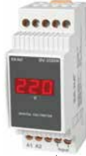
DV-35 KLASİK DIN