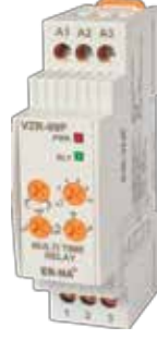
VZR-09P V-OTOMAD DIN