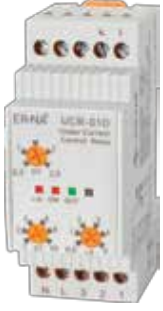
UCR-01D KLASİK DIN