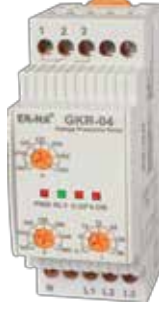
GKR-04 KLASİK DIN