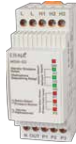
MSR-03 KLASİK DIN