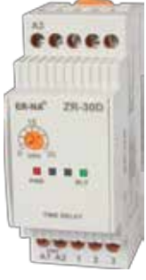
ZR-30 KLASİK DIN