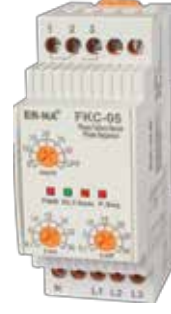
FKC-05 KLASİK DIN