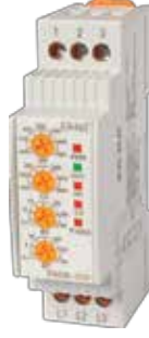
VADR-07F V-OTOMAT DIN NOTÜRSÜZ