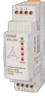
VKC-25F V-OTOMAT DIN