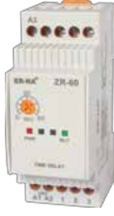
ZR-60 KLASİK DIN