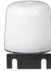
FR-G FOTOSEL GÖZ