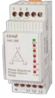
FKC-30F KLASİK DIN