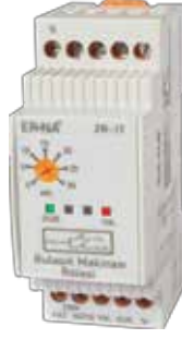
ZR-1T KLASİK DIN