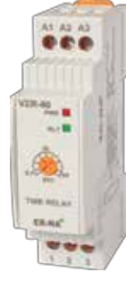
VZR-60 V-OTOMAT DIN