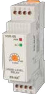
VSR-05 V-OTOMAT DIN