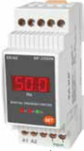
DF-35 KLASİK DIN