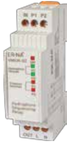
VMSR-02 V-OTOMAT DIN