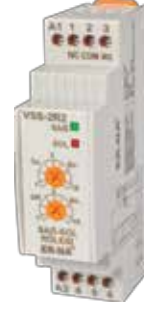
VSS-2R2 V-OTOMAD DIN