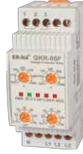
GKR-05F KLASİK DIN