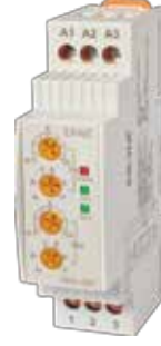
VBR-8P V-OTOMAD DIN