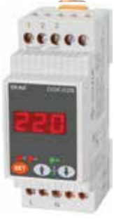
DGK-02M KLASİK DIN