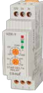
VZR-Y V-OTOMAD DIN