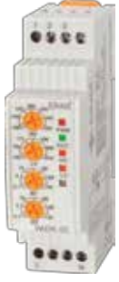
VADR-02 V-OTOMAT DIN