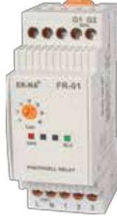
FR-01 KLASİK DIN