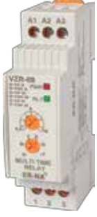
VZR-08 V-OTOMAD DIN