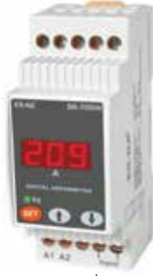
DA-35 KLASİK DIN