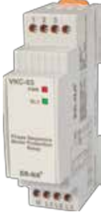
VKC-03 V-OTOMAT DIN