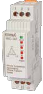
VKC-24F V-OTOMAT DIN