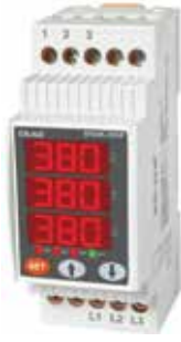
DGK-05F KLASİK DIN