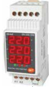
DV-35S KLASİK DIN