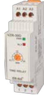
VZR-30D V-OTOMAT DIN