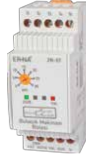
ZR-5T KLASİK DIN