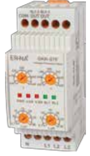
GKR-07F KLASİK DIN