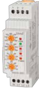
VADR-05F V-OTOMAT DIN